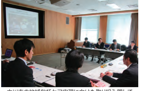
立川市の地域包括ケア実現に向けた取り組みに関して質疑応答を行いました。