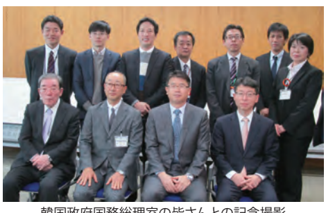
韓国政府国務総理室の皆さんとの記念撮影

今回は、主に立川市が行っている高齢者福祉等の「地域包括ケア」の取り組みについての視察に来られました。韓国も日本同様に少子高齢化が進んでおり、2008年から介護保険制度が開始されています。立川市の取り組みに対し非常に興味を持っていただき、多くのご質問もいただきました。社会保障制度の多様な取り組みについて、今後ますます両国の交流の推進が必要になると考えられます。