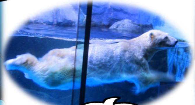
白クマも泳いでたね