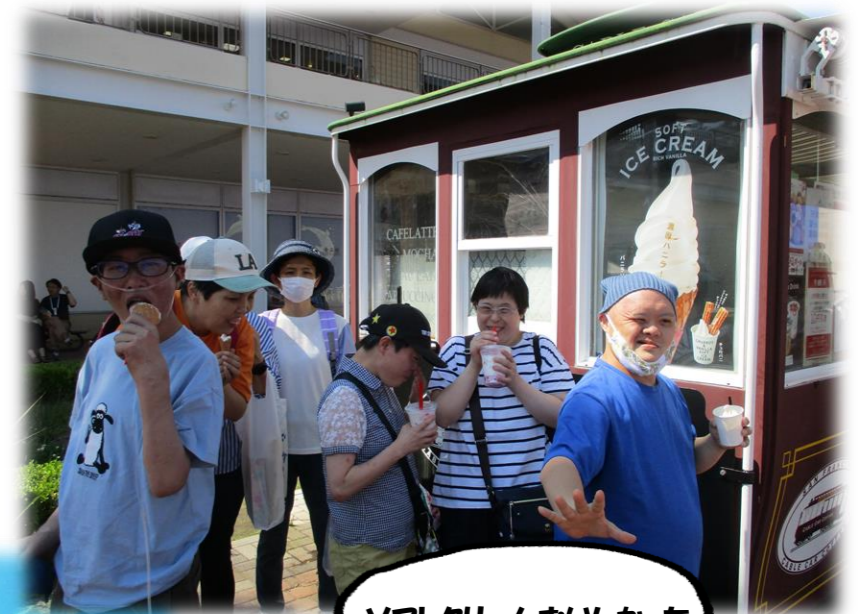
ソフトクリームおいしかった

午後は再度海の生き物を観賞 したり、おみやげを買ったり、 食後のデザートでソフトク リームやクレープ、コーヒーや紅茶 を楽しんだり最後の最後まで 水族館を満喫しました。