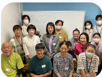
← ちょこボラ 交流会の様子

現在、登録いただいている「ちょこボラ」の方には、訪問や電話による定期的な見守り、ゴミ出しのお手伝いなどの個人への支援に加え、地域包括支援センターや地域福祉コーディネーター主催のイベントでの設営や受付などのサポートでもご活躍いただいています。