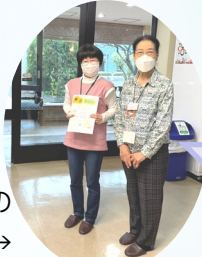
普段の活動の 様子 →